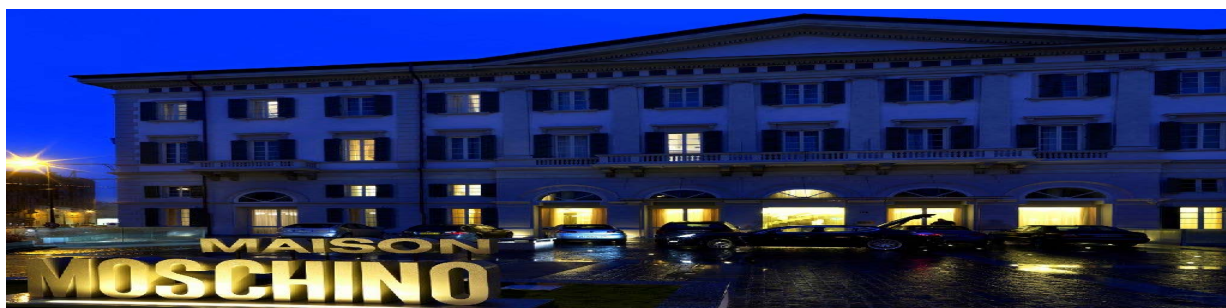
CLANDESTINO - MAISON MOSCHINO, MILANO.