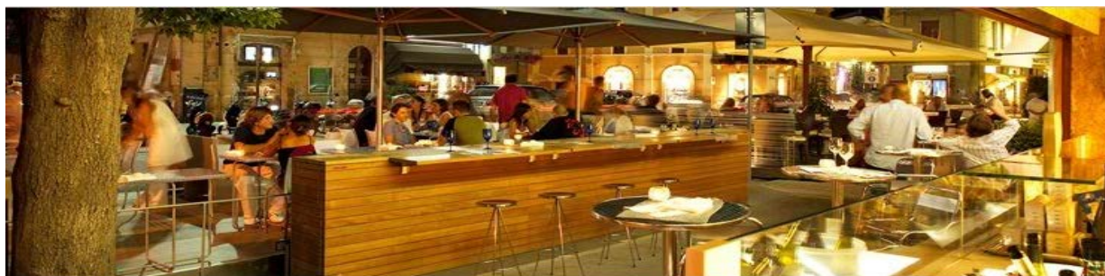
ANIKÒ SALUMERIA ITTICA - SENIGALLIA, AN.