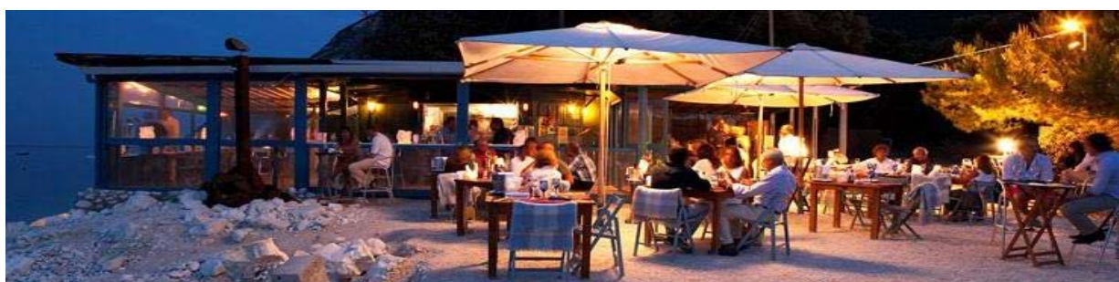
CLANDESTINO SUSCI BAR - PORTONOVO, AN.