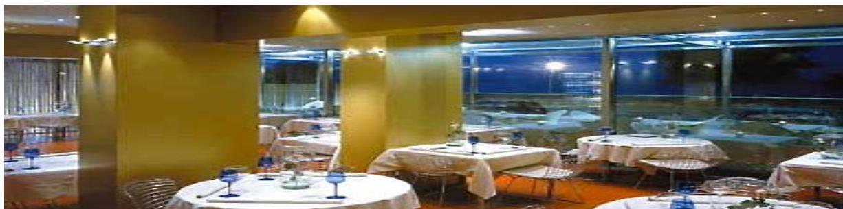
RISTORANTE LA MADONNINA DEL PESCATORE - SENIGALLIA, AN.